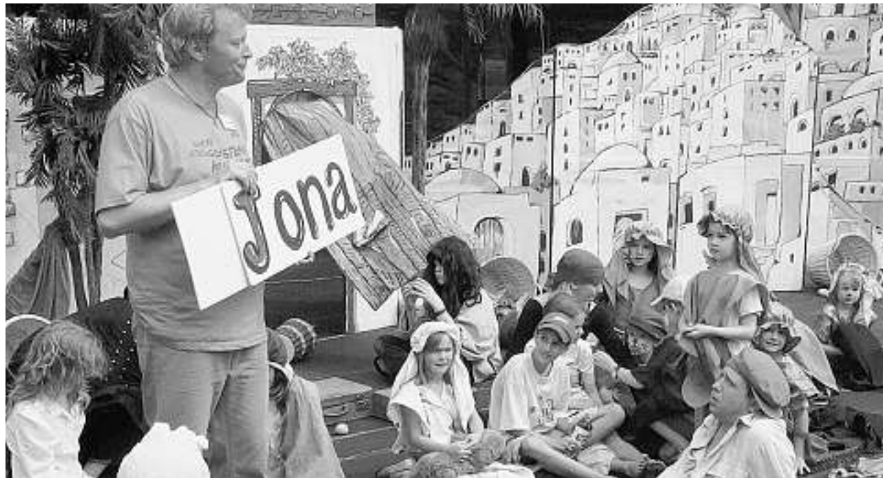
Theater, selber gemacht: Statt nur zuzuschauen, wirken Kinder gleich selber auf der Freilichtbühne mit.