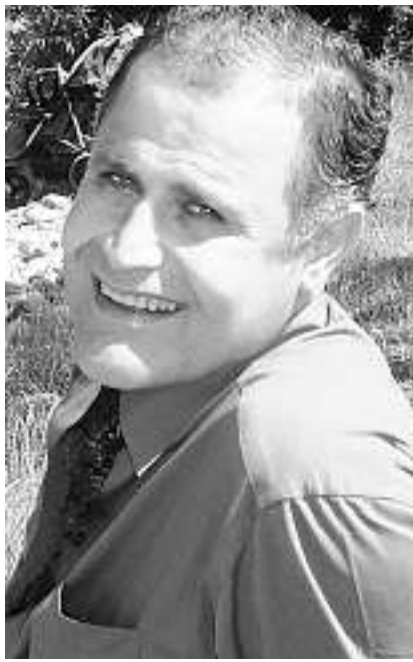
Aram erlebte die Grausamkeiten des Krieges – und verbreitet Hoffnung.

19 Uhr schliesst «Eine neue Chance – auch für mich?» die Serie ab. Alle leben davon, dass man neue Chancen kriegt. Doch wie erkennt man eine neue Chance und vor allem wie nutzt man sie? Was muss beendet werden, damit ein neuer Anfang gewagt werden kann? Welche Rolle spielt Gott dabei? All diese Fragen werden im Bibelinput mit Reto Pelli erörtert.